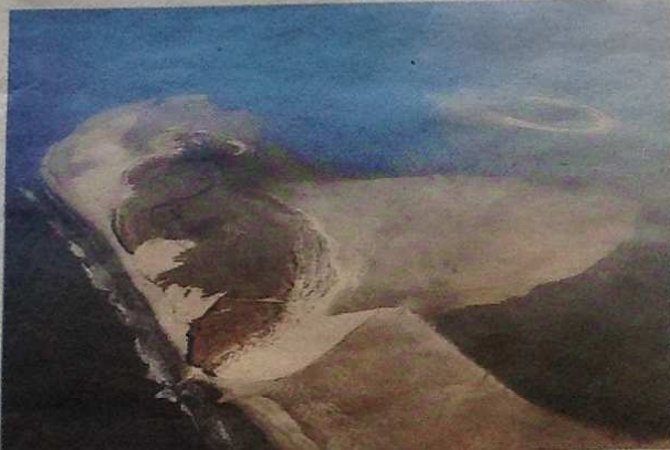
▲ Een luchtfoto van Rottumeroog, een jaar geleden, voor de zware decemberstorm. Ook toen had de zee al stukken duin weggeslagen en het zand verspreid over het eiland.

En wat gebeurt er met de monumentale Kaap? Die blijft gewoon staan, zegt Pietermel Overmars van de eigenaar, de gemeente Eemmond. „Hij is niet in gevaar, hij staat heel erg stevig.” De gemeente is ook niet van plan iets te doen aan de straatnamen die afgelopen jaar aan het onbewoonde Rottumeroog werden toegekend: Marten Toonderpad en Jan Brandspad. Een actie die nogal wat verwondering opriep. „Die blijven, we trekken ze niet in omdat de bebouwing nu verdwijnt”, zegt de woordvoerder kortaf.